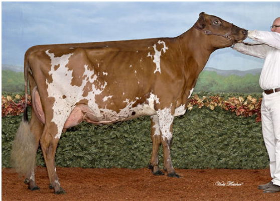
MONEY MAKING RUBICOM MANGUEL