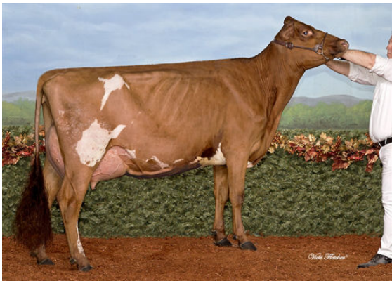
CADRIJO RUBICOM MAMZELL